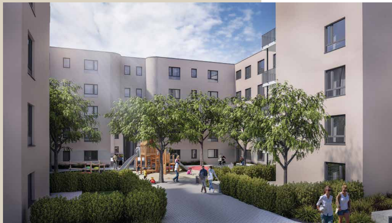
Die unterirdischen Parkplätze sorgen für ein autofreies Wohnbild und eine sichere Umgebung für die Bewohner, insbesondere für Kinder.