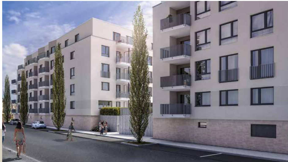
Blick vom Heiligenstock: Eine moderne Formgebung in Kombination mit zeitlosen Materialien zeichnet die stilvolle Architektur aus.