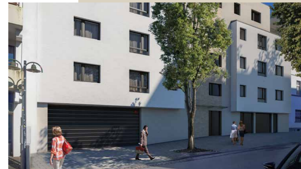
Über die Tiefgarageneinfahrt fahren Sie in die unterirdisch gelegenen Parkdecks. Von dort kommen Sie komfortabel in Ihre Eigentumswohnung.