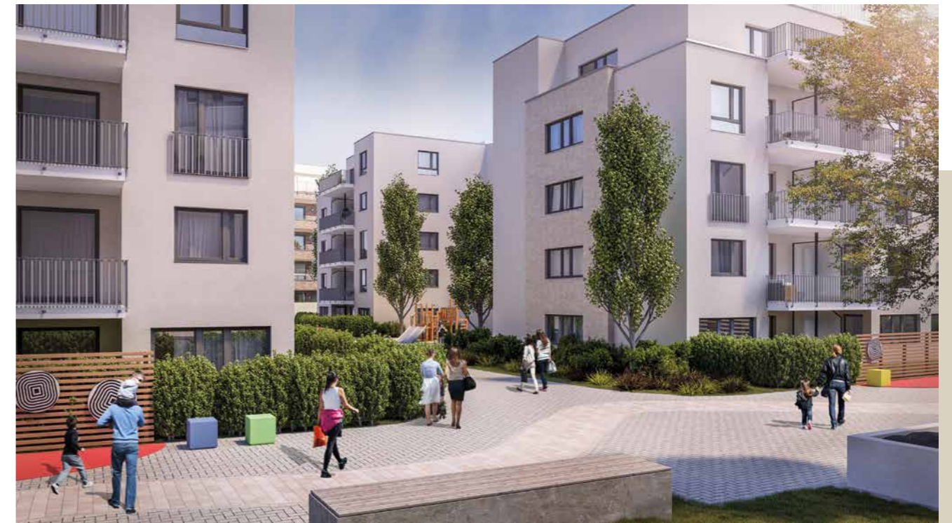
Der Ohligs-Boulevard schließt nahtlos an die Fußgängerzone an und lädt zum Spazieren und Verweilen ein.